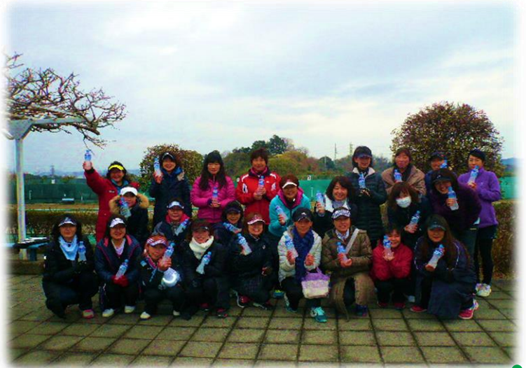
寒い冬の接近を知らせる飛行機雲の下♪